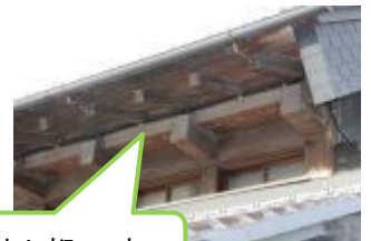
これが「出し桁」です

た。 だしげたづくり 「出し桁造り」 や土蔵の「うし ばり梁」などが 特色です。