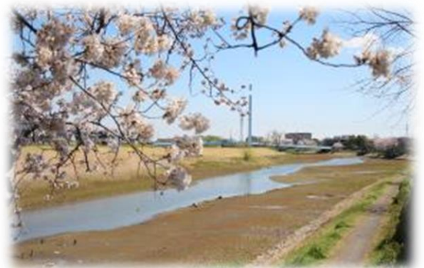
春うらら（瓦葺根溜井跡）

一つ目の疑問は保存意義そのものを問うもので、この時は職員一同、驚いてしまいました。二つ目は大した想像力だと感心しました。不定時法という近世の時刻設定では、 太陽の出ている時間 に合わせて概ね2時間前後を一区切りにしていました。従って家の向きも大切で、 のき ひきし 軒・庇の深さも方位によって異なるものでした。古民家を保存していくと、このようなことも検証できるわけです。