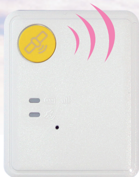
原寸大(縦47.5mm 横38.5mm 厚さ11.85mm)

認知症により外出時に行方不明になるおそれのある高齢者を在宅で介護する介護者に、位置検索端末機を貸与します。 (委託先:ホームネット株式会社)