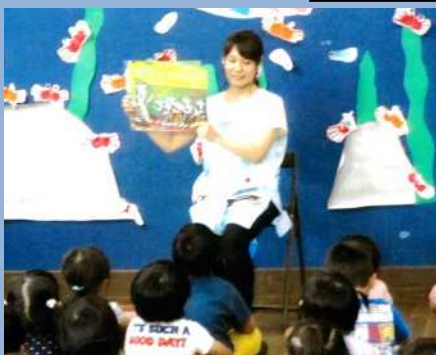
やってみたいあなたを応援します!!

新任保育士、中堅保育士、保育主任、施設長など段階別に交流研修等を実施。つながれる仲間がいる(困っても孤立しない)環境作りに取り組んでいます。